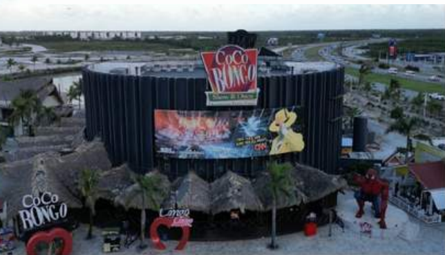
COCO BONGO (10MIN)