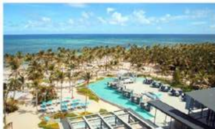
PLAYA CABEZA DE TORO PEARL BEACH CLUB (16 MIN)