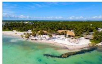
PLAYA BLANCA (20 MIN)