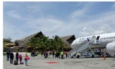
AEROPUERTO INTERNACIONAL DE PUNTA CANA (20 MIN)