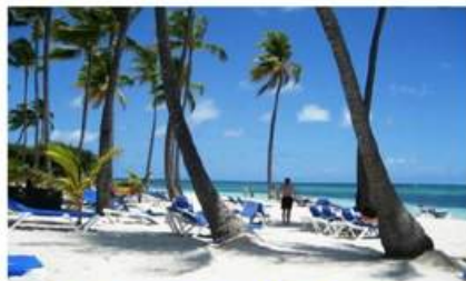
PLAYA BIBIJAGUA (18 MIN)