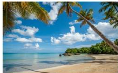
PLAYA BONITA (14 MIN)