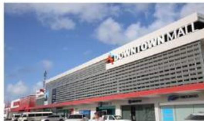
DOWNTOWN MALL (10 MIN)